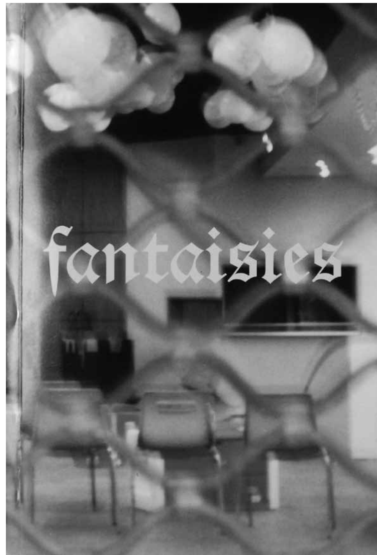
Fantaisies , Claude Lévêque, Éd. Sixtus, 1999