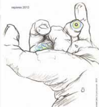
Illustration © J. Le Petit Jaunais - 2010