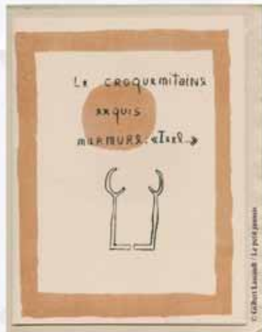
Le petit poisson